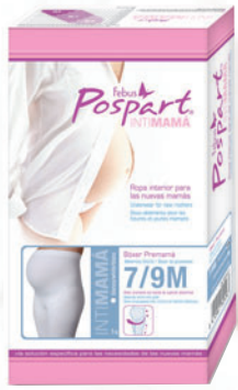
Bóxer Premamá 7/9M

Talla S/M C.N.150097.7 Talla L/XL C.N.150098.4 Talla XXL C.N.150099.1