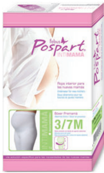
Bóxer Premamá 3/7M

Talla S/M C.N.150093.9 Talla L/XL C.N.150095.3 Talla XXL C.N.150096.0